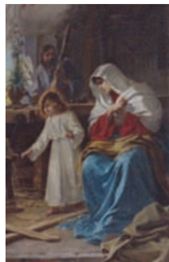
La Sacra Famiglia, Arcipretale di Mel (Myriam Curti)

Della poco conosciuta produzione sacra, l'amato pittore zumellese (1860-1945) ha lasciato testimonianza in molte chiese della Sinistra Piave. Ben poco in confronto alle innumerevoli opere sparse per il Veneto e per l'Europa. Nel 150° anniversario dalla nascita, Mel desidera ricordarlo così.