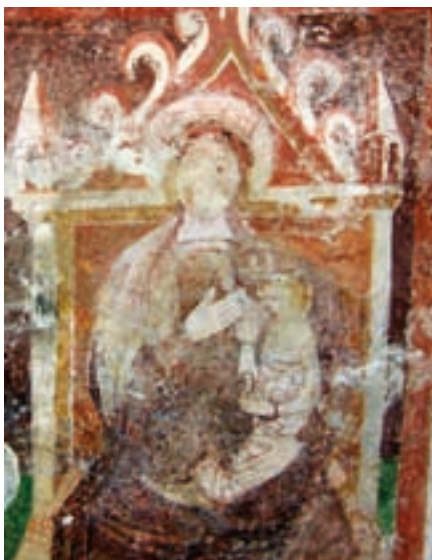
Madonna del latte, chiesa di Bardies (Myriam Curti)

Da sempre la religiosità popolare delle genti della Valbelluna si è volta con fervore alla Vergine Maria. Molti sono in Sinistra Piave i luoghi di culto dedicati alla Madonna o la cui storia è legata ad Essa. Ve ne proponiamo alcuni.