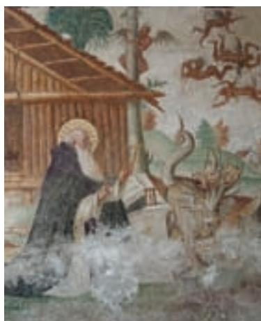
Le tentazioni del demonio, Bardies chiesa di S. Antonio abate

Follo - S. Gottardo (arti inferiori) Gus - S. Nicola (infanzia) Samprogno - Ss. Vittore e Corona (bestiame) Carfagno - S. Marco (scrivani, ottici) Nate - S. Isidoro (agricoltura) S. Antonio Tortal - S. Antonio Abate (animali)